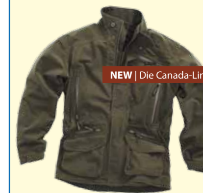
NEW | Die Canada-Linie

Waidmannsheil Ihr Chevalier-Team Schweiz