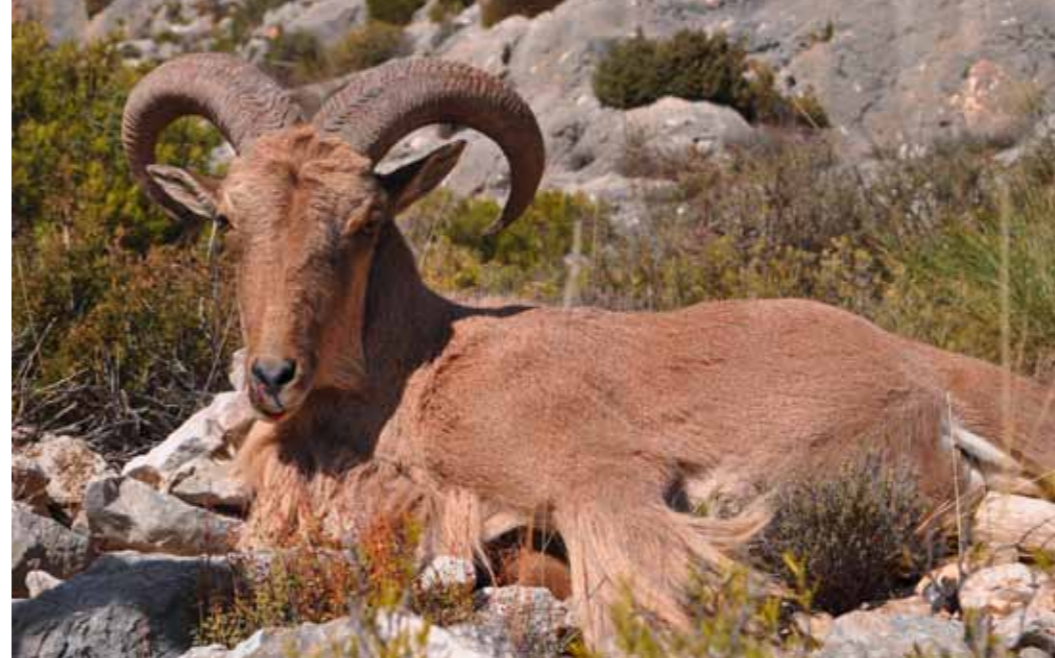
Männliche Mähnspringer erreichen Gewichte über 100 Kilogramm.