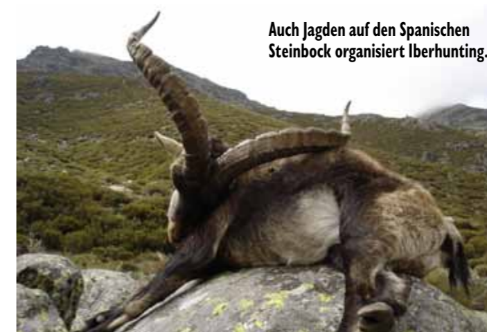
Auch Jagden auf den Spanischen Steinbock organisiert Iberhunting.

Weitere Informationen unter www.iberhunting.com und www.hunting-adventure.ch